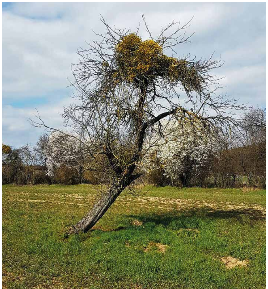
Abb. 5: Gefährdete Obstbäume mit starkem Mistelbesatz, die von weitem wie „Brokkoli-Bäume“ aussehen, sind eine Herausforderung für den hessischen Naturschutz.

meint sind in der Regel alte Apfel- oder Birnen-Hochstämme mit sehr starkem Befall der Laubholz-Mistel ( Viscum album ). Infolge oft seit Jahrzehnten ausgebliebener Schnittmaßnahmen haben Misteln hessenweit viele alte Bäume so stark in Beschlag genommen (Abb. 5), dass diese von weitem wie Brokkoli-Pflanzen aussehen. Besonders stark wirkt dieser Effekt bei Bäumen in nicht belaubtem Zustand. War ein Befall von Obstbäumen mit den damals noch relativ seltenen Misteln vor wenigen Jahrzehnten bei Naturschützern durchaus noch gerne gesehen (KORNPROBST 1994), so hat sich die Situation grundlegend verändert. Misteln sind in einigen Gegenden inzwischen zum echten Problem geworden. Die Pflanzen leben als Halbschmarotzer und entziehen dem Wirt mit ihren Saugwurzeln Wasser und Nährstoffe. Bei starkem Befall dürfte auch die Windwurfanfälligkeit beson-