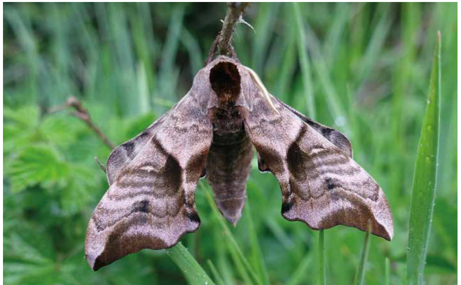
Abb. 6: Streuobstwiesen sind auch Lebensraum des Abendpfauenauges ( Smerinthus ocellata ).

Das Potenzial ist groß. Gerade beim Streuobst besteht die Chance, die Aspekte „Heimat“ und „Regionale Identität“ mit dem Klimaschutzgedanken in Ein-