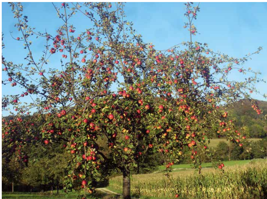
Abb. 1: Streuobstwiesen beherbergen oft an das regionale Klima angepasste, robuste und alte Obstsorten.

Der Schwerpunkt der Verbreitung liegt in den bekannten Obstbaugebieten im