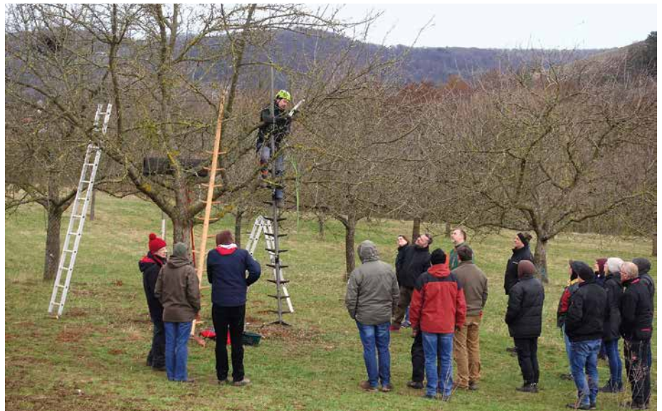
Abb. 2: Schnittkurse, die wie hier von der hessischen Naturschutzakademie Wetzlar und dem NABU Main-Kinzig angeboten werden, leisten einen wichtigen Beitrag zum Erhalt unserer Streuobstbestände.

rus ), Wendehals ( Jynx torquilla ), Klein- und Grünspecht ( Dryobates minor und Picus viridis ), Steinkauz ( Athene noctua ) und Dorngrasmücke ( Sylvia communis ) finden sich regelmäßig in größeren, gut ausgestatteten Streuobstbeständen. Andere Arten, die auf Streuobstlandschaften mit niedrigem Unterwuchs angewiesen sind, wie etwa der Rotkopfwürger ( Lanius senator ), sind in Hessen als Folge