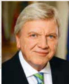
Ihr Volker Bouffier

im Mai vor zehn Jahren haben wir die Nachhaltigkeitsstrategie Hessen gestartet und die Nachhaltigkeitskonferenz hat zum ersten Mal getagt. Gemeinsam haben wir seitdem viel erreicht: Unser partizipativer Ansatz hat uns intensive und zielorientierte Diskussionen in neuer Zusammensetzung und mit vielen unterschiedlichen Perspektiven ermöglicht. Daraus sind innovative Ideen entstanden, und wir haben bereits zahlreiche konkrete Maßnahmen angestoßen und umgesetzt. Aber es warten noch weitere große Herausforderungen auf uns, die wir zusammen mit Ihnen in den nächsten Jahren angehen werden. Lassen Sie uns die 10. Sitzung der Nachhaltigkeitskonferenz nutzen, um unsere weitere gemeinsame Arbeit zu