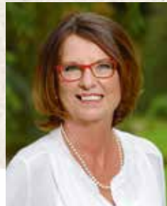
Ihre Priska Hinz

Wir laden Sie herzlich zum öffentlichen Veranstaltungsteil der 10. Nachhaltigkeitskonferenz ein und freuen uns, wenn Sie am 3. Mai 2018 im Wiesbadener Kurhaus zur Feier des Jubiläums der Nachhaltigkeitsstrategie zu Gast sind.